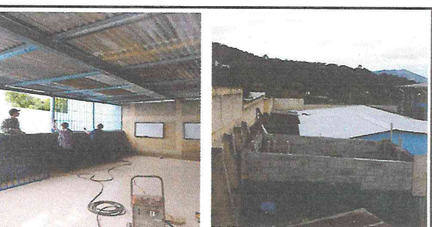
Foto 6: Realizando trabajos de colocacion de balcones y sustitucion de lámina, por lámina troquelada y estructura del techo de cocina.

Observación: Si es necesario se pueden agregar hojas adicionales y actualizar el número de hojas.