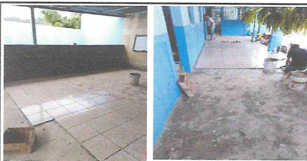
Foto 5: Realizando trabajos de colocación de piso cerámico en cuatro aulas y un corredor