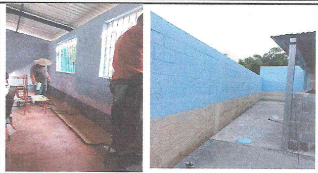
Foto 2: Padres de familia colaborando con la realizacion de pintura en interior y exterior de la escuela.