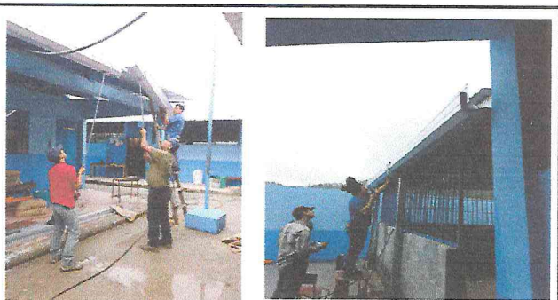
Foto 4: Realizando la colocación de los canales en las caidas de agua