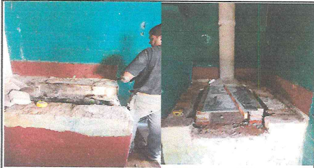
Foto1: Realizando los trabajos de sustitucion de plancha de cocina.